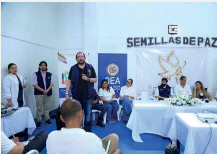
Foto: Apertura del diplomado en pedagogía de paz en establecimiento Penitenciario y Carcelario de Alta y Mediana Seguridad de Valledupar: La Tramacúa

Es importante agregar que en el comienzo del segundo semestre 2023, fortalecimos las gestiones para la ejecución de los informes de cierre de proyectos como el de la CEI (fase I) y ADVENIAT; se gestionaron nuevos proyectos con Embajada de Suecia, CEI y se tiene listo pero en stand by la propuesta ADVENIAT; no se pudo avanzar con la Embajada de Noruega y se fortalecieron las herramientas de monitoreo y evaluación de proyectos, administrativas y contables, que inciden directamente en la presentación de informes y reportes.