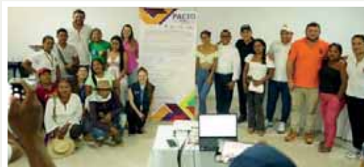
Foto: Encuentro con candidatas, proyecto de incidencia política de Mínimos de Reconciliación Y Paz en el Vicariato Apostólico de Leticia Con el apoyo solidario de: CEI