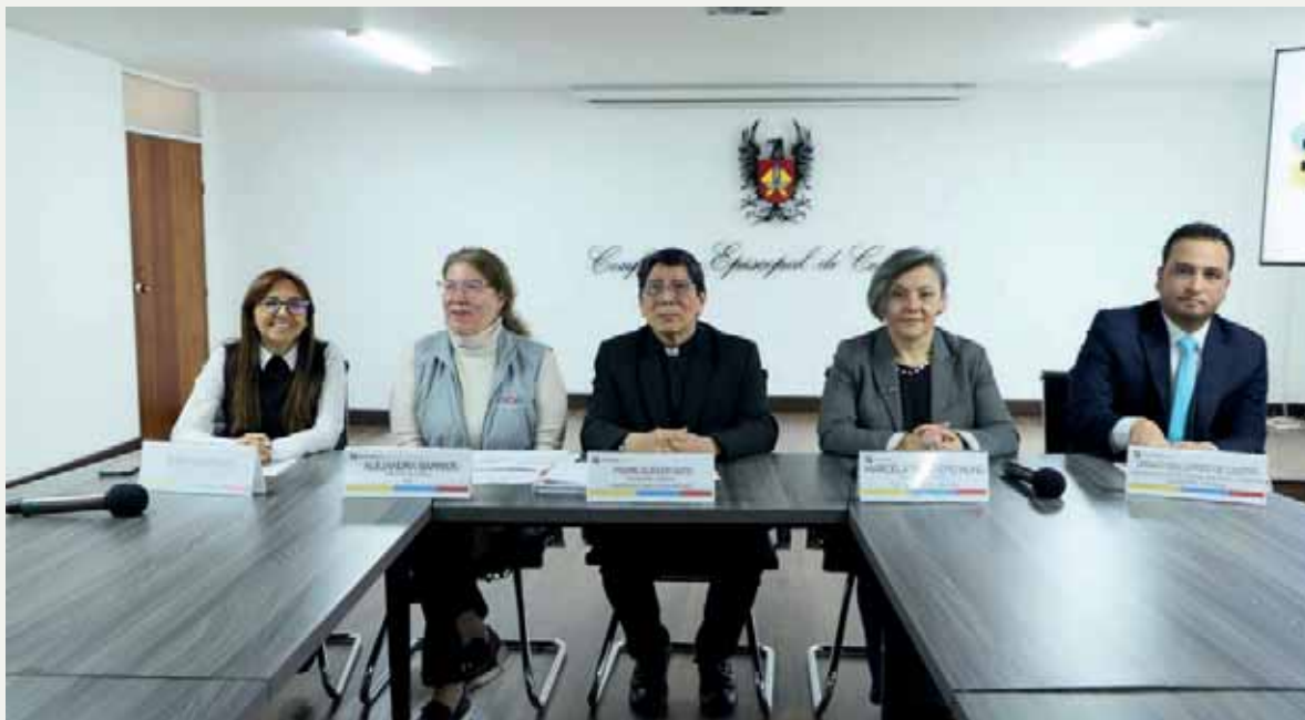
Presentación a medios de comunicación campaña ¡Pilas No Bote el Voto! MOE- CEC-CCN-SNPS 2023

Finalmente, se ha establecido contacto y articulación con espacios amplios del sector educativo y academia, como el caso de la red de ciencia y educación para la construcción de paz y reconciliación, el programa sagrado y profano de la escuela de Historia de la UIS; con quienes se han desarrollado actividades de sensibilización en torno a la lectura de las dinámicas del conflicto y construcción de los mismos mínimos para la paz y de propuestas pedagógicas para avanzar en cultura y acciones concretas de paz y reconciliación; así como destacar y visibilizar el compromiso histórico de la Iglesia católica en Colombia por acompañar a las comunidades en medio del conflicto y aportar a iniciativas de paz y desarrollo.