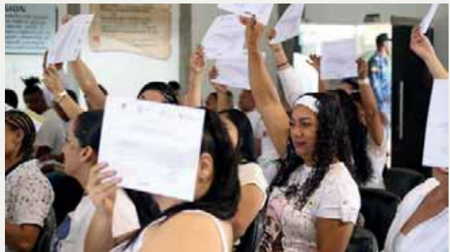
Fotos: Clausura de diplomado en “herramientas para la ambientación de escenarios de negociación que conduzcan a acuerdos para la reconciliación y la paz” Complejo Penitenciario de Mujeres, de Jamundí