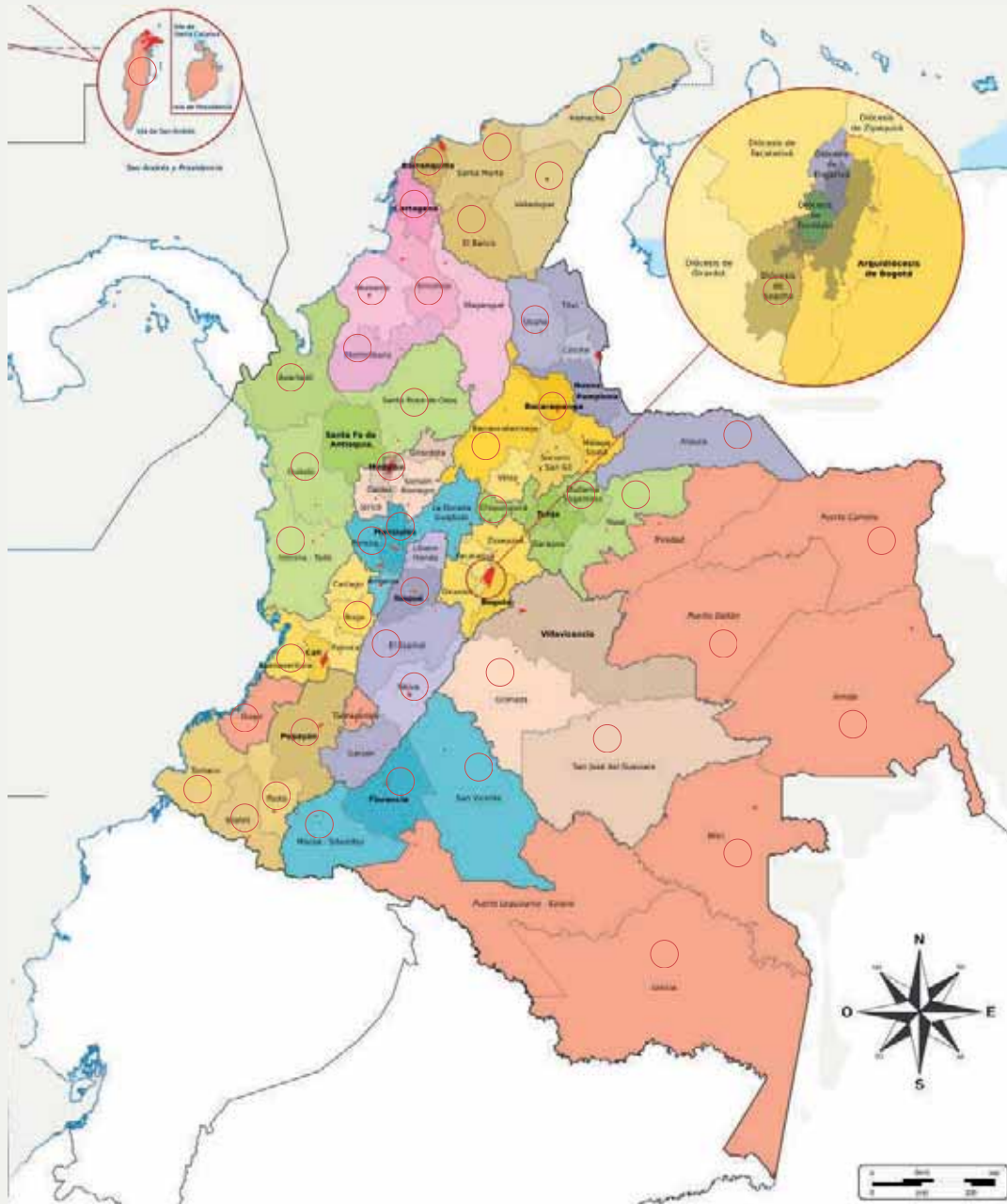
Foto: Mapa que muestra la acción en incidencia política de la Conferencia Episcopal de Colombia, a través de la Comisión de Conciliación Nacional con su proyecto de Mínimos de Reconciliación y Paz