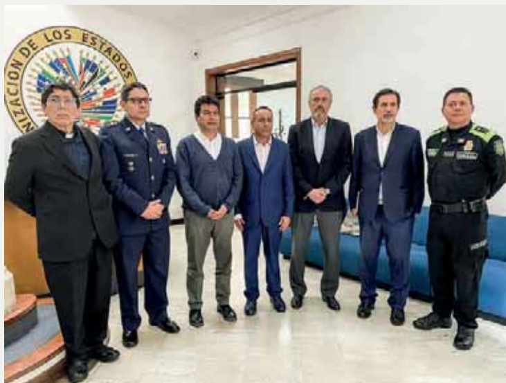
Foto: Instalación del mecanismo de verificación del cese al fuego con el Estado Mayor Central de las FARC-EP abril de 2023

En este sentido, asistimos a un taller convocado por la oficina RIEC, cuyo objetivo era compartir la pedagogía del cese al fuego bilateral entre Estado y ELN, de tal forma se procure la articulación y coordinación de la formación y el desempeño de los delegados regionales y locales a los mecanismos de veeduría y monitoreo del cese al fuego, tanto con el ELN, como con el EMC FARC-EP. Esto permite un mismo lenguaje en la participación de la Iglesia católica en los diferentes procesos de negociación que se surten en el país.