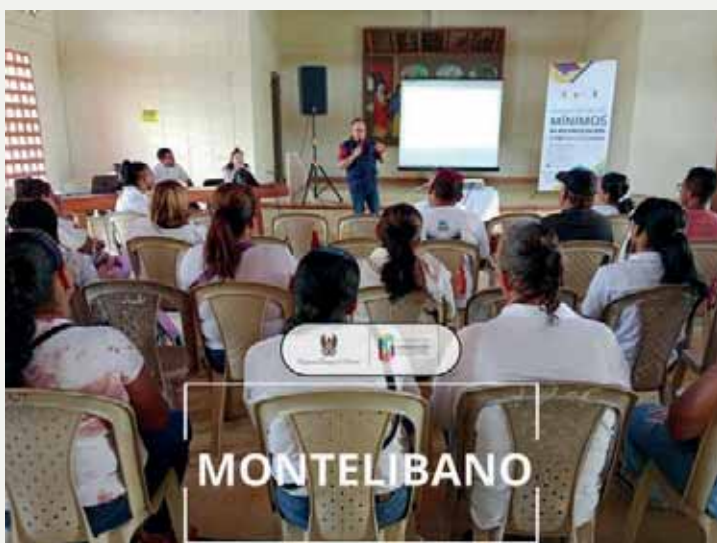
Foto: Encuentro con comunidades en la Diócesis de Montelíbano-Proyecto Mínimos de Reconciliación y Paz en Colombia

Por esto, en la actual vigencia, las acciones de la CCN se han orientado a contribuir a la construcción de la reconciliación y la paz en bajo una perspectiva de acuerdo nacional, por esta razón se han pensado y ejecutado estrategias de sensibilización, promoción, investigación e incidencia encaminadas a la construcción de una cultura de paz territorial integrada a la paz nacional. Es también por lo que se viene trabajando en el fortalecimiento de los Comisionados como órgano consultivo y asesor del episcopado y de la secretaría técnica de la CCN, en el acompañamiento de la población civil y los excombatientes en el marco del post-acuerdo, en el escenario de renovación de compromisos de los actores armados desde los Centros de Privación de la libertad, incluyendo a los presos políticos y personas privadas de la libertad que quieren sumar a los esfuerzos y procesos de paz total.