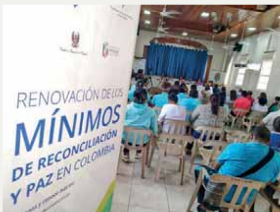
Foto: Encuentro de incidencia política en el Vicariato Apostólico de San Andrés y Providencia