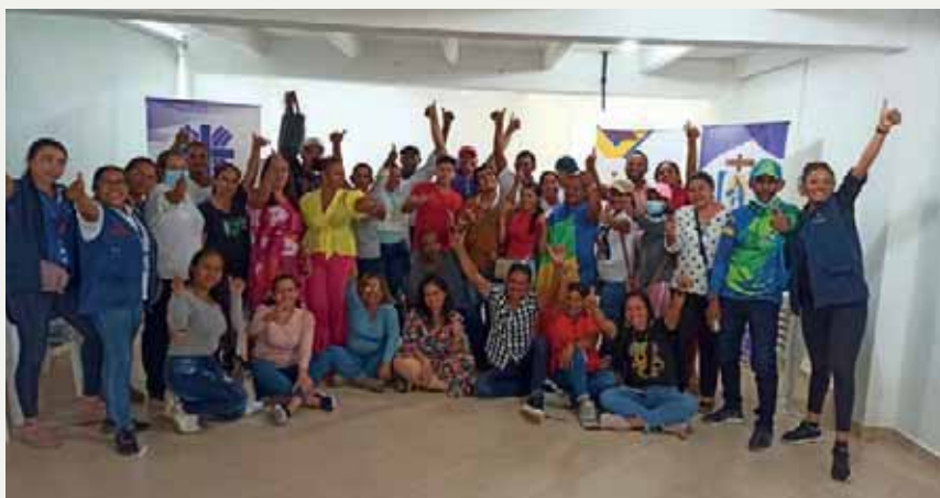
Foto: Encuentro con comunidades en la Diócesis de Santa Marta-Proyecto Mínimos de Reconciliación y Paz en Colombia

Se realizaron los ajustes solicitados por la Junta Directiva a los Estatutos, se espera revisión y validación de los mismos de parte de la Arquidiócesis de Bogotá.