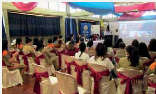
Fotos: Clausura de diplomado en pedagogía de paz en cárceles de Colombia Con el apoyo solidario de la embajada de Suecia en Colombia