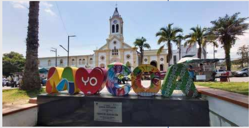
Fotografía tomada en el Parque General Santander a la Catedral San Miguel Arcángel, Mocoa (Putumayo). Archivo CCN, 2020.