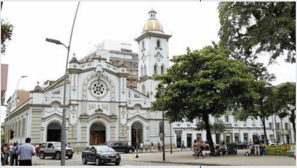
Fotografía de la Catedral Inmaculada Concepción, Ibagué (Tolima). Archivo CCN, 2019.