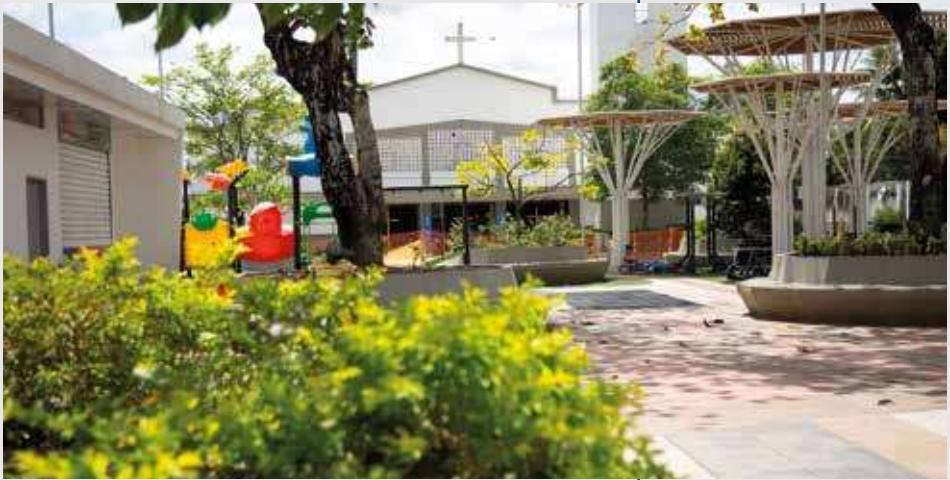
Fotografía de la Parroquia San Sebastián, Chigorodó (Antioquia).