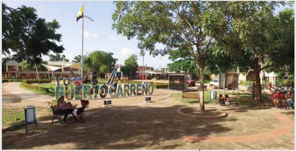
Fotografía tomada en el Parque Santander, Puerto Carreño (Vichada).