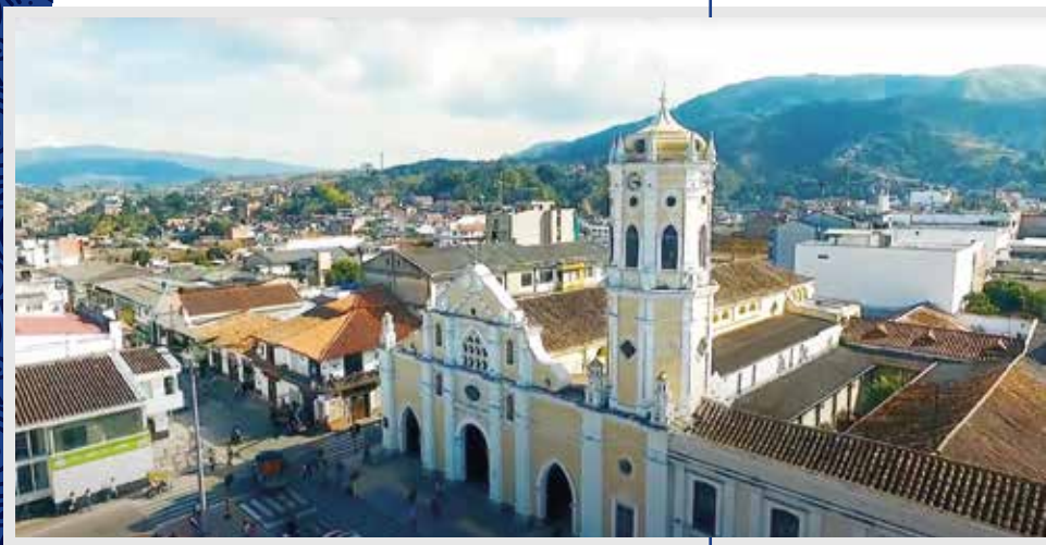
Fotografía de la Catedral de Santa Ana, Ocaña (Norte de Santander). Archivo CCN, 2020.