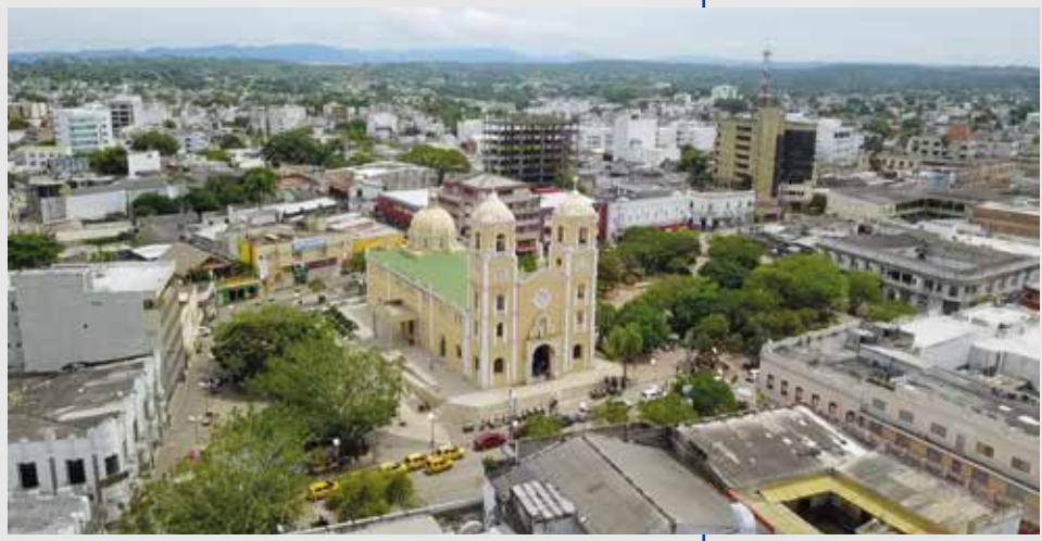
Vista aérea del centro del municipio de Sincelejo sobre la Catedral San Francisco de Asís, Sincelejo (Sucre).