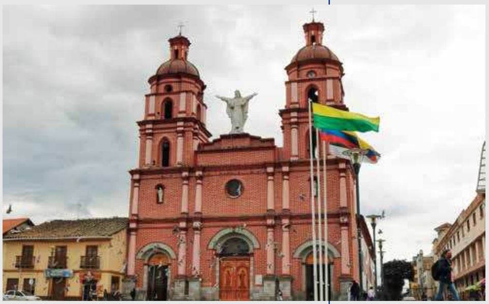
Fotografía de la Catedral de San Pedro Mártir, Ipiales (Nariño).