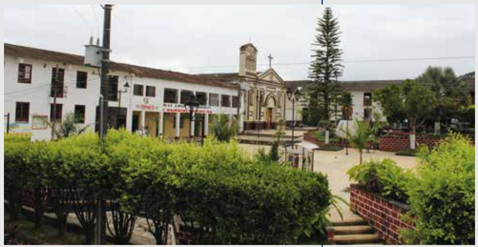
Fotografía tomada en el parque central del municipio de Támara a la Parroquia La Inmaculada Concepción, Támara (Casanare). Archivo CCN, 2020.