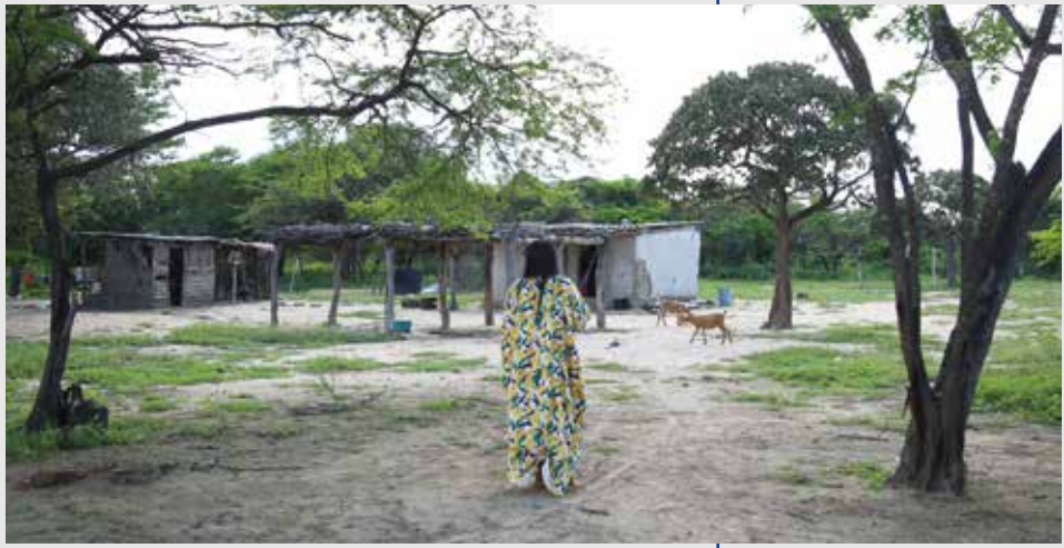
Vista interior de la Comunidad indígena Wayú 'Paraíso', ubicada en el área rural de Riohacha (La Guajira). Archivo CCN, 2020.