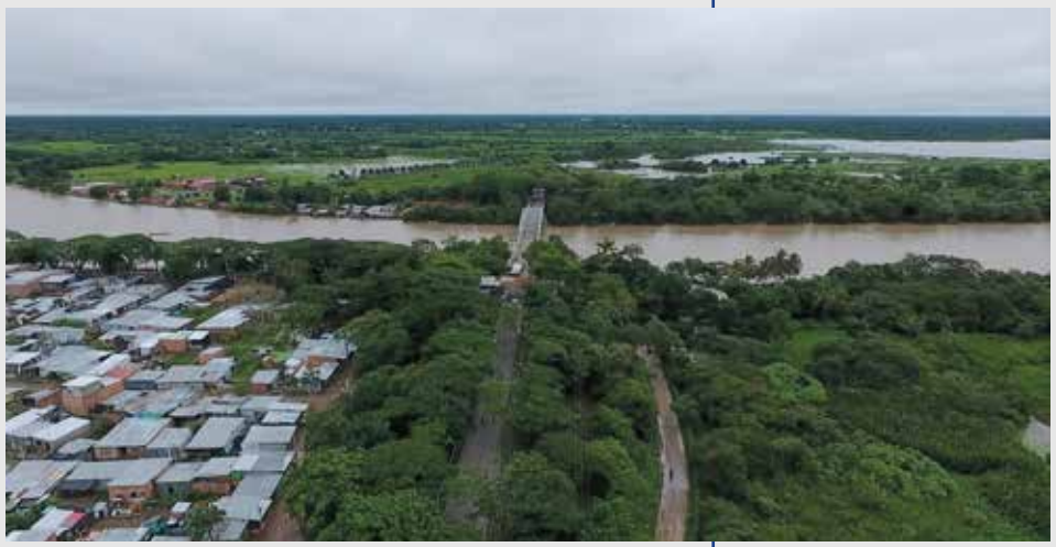
Vista aérea del río Arauca y del Puente Internacional José Antonio Páez, ubicado entre Arauca (Colombia) y Amparo de Apure (Venezuela).