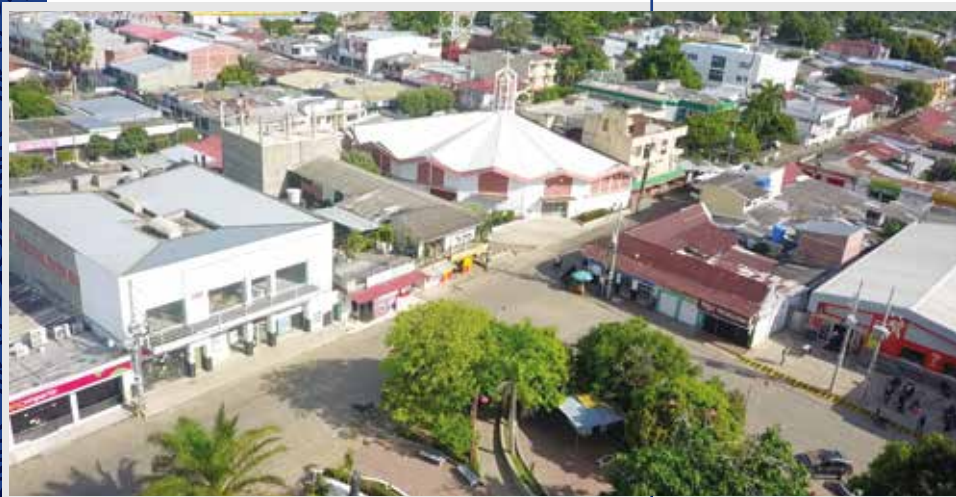
Vista aérea del centro del municipio de Montelíbano sobre la Catedral de La Santa Cruz, Montelíbano (Córdoba). Archivo CCN, 2020.