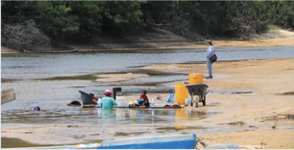
Fotografía tomada en río Iteviare, ubicado en la vereda de Puerto Trujillo, Puerto Gaitán (Meta).