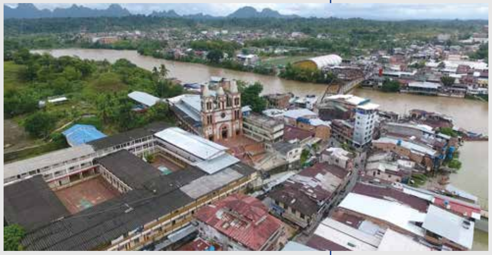
Vista aérea del municipio de Istmina sobre la Catedral San Pablo Apóstol y los barrios ubicados junto al río San Juan, Istmina (Chocó).