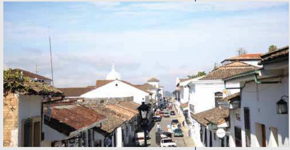
Fotografía tomada en el centro histórico de la ciudad de Popayán, Popayán (Cauca). Archivo CCN, 2020.