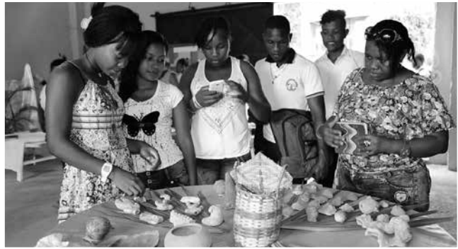
Comunidad de jóvenes