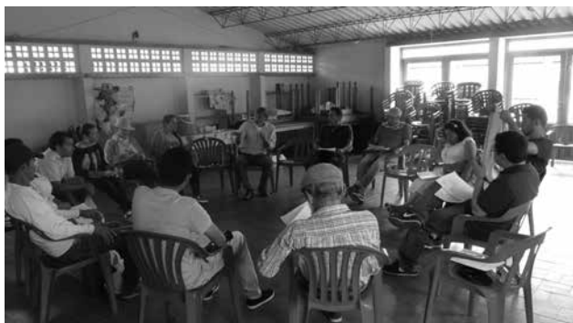
Grupo del diplomado