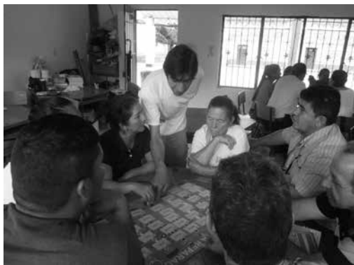
Juego Aprender ley de víctimas